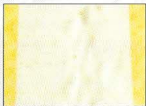
Skrynkelmärken mitt på våden. Ryppyjuälkiä kankaan keskellä. Bölgegang. Rynker midt på dugen.

Tekniske tekstiler har nogle kendetegn, som til trods for stor omhyggelighed i design og produktion, kan virke som fejl i vævningen. Det kan således føre til klager og reklamationer. Men disse fejl påvirker ikke dugens levetid. Folder eller rynkemærker som disse kan ikke undgås. De opstår oftest dér, hvor dug-banerne er syet sammen eller bukket om. På disse steder er dugen dobbelt så tyk som ellers og fylder derfor mere. Det er simpelthen årsagen – og alle duge gør sådan. Det synes blot mere på ensfarvede duge. De Du kan se eksempler på disse fænomener på fotografierne. Der er altså ingen grund til at reklamere over dette.